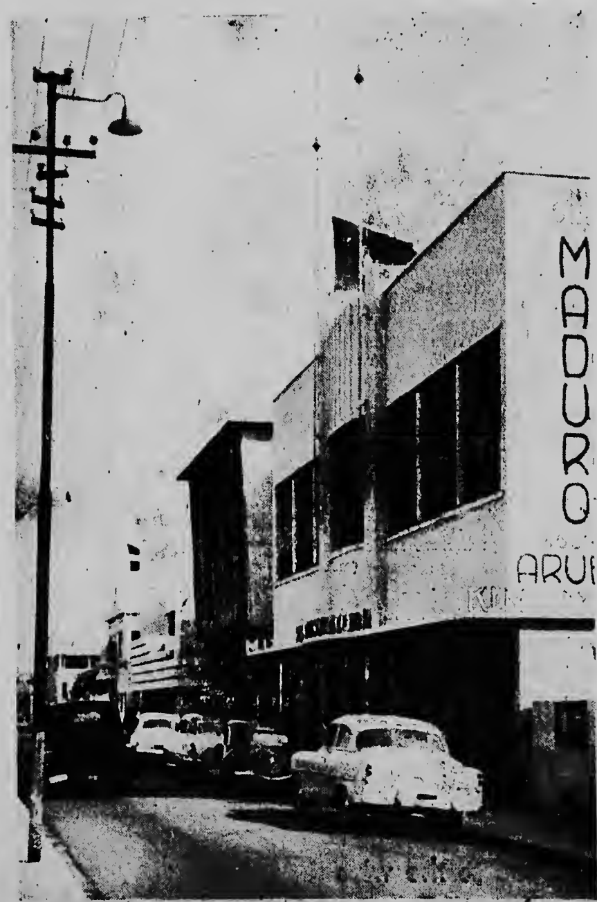
Gistermorgen werd in de R.K. Kerk te Oranjestad een Plechtige H. Mis van Requiem opgedragen voor de zielrust van kolonel Remon, de vermoorde president van Panama. Op alle consulaten wapperden daarom gisteren de vlag halfstok.

De nieuwe miss France, die het komende jaar nog te zien zal zijn bij verkiezingen voor miss Europe en miss Monde, heeft in een gelukkige inval aan de belangstellende journalisten verklaard, dat zij bij de film wil, het-